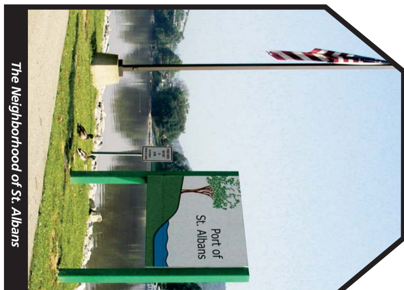
The Neighborhood of St. Albans

Downtown Charleston • Patrick Street Plaza Riverwalk Plaza • Thomas Hospital St. Albans Mall • St. Albans Plaza