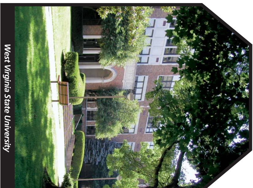
West Virginia State University

Kanawha Valley Regional Transportation Authority North Charleston / Dunbar Institute-Nitro ROUTE 3 Downtown Charleston • Orchard Manor WV State College • WVA Rehab. Ctr. Nitro Market Place • Tri-State Resort